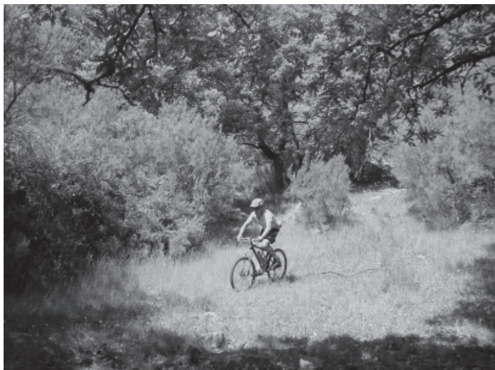
Pedaleando por la «Garganta de Diego Díaz»

Camino de la ermita de Montejaque, las primeras cuestas importantes nos obligan a bajar de las bicis, el desnivel es imponente, ya en la ermita bajamos por las zetas del antiguo camino empedrado que nos lleva a Montejaque. Desde esta serrana población nos encaminamos hacia los llanos de Libar, acompañados por las impresionantes paredes de las sierras de Montalate y Juan Diego subimos por el empinado camino hasta el primero de los llanos y después de atravesar un adehesado monte llegamos al segundo de estos llanos. Atravesamos los llanos junto a las formaciones calizas de las sierras de Libar y Blanquilla, en los Hoyos de Cortes dejamos atrás estos espectaculares parajes karsticos para comenzar una loca bajada hacia Cortes de la Frontera.