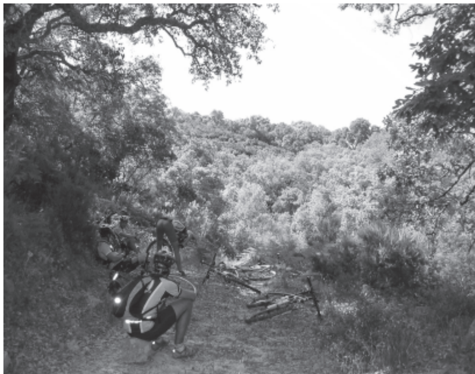
Descansando en la Garganta de Diego Díaz