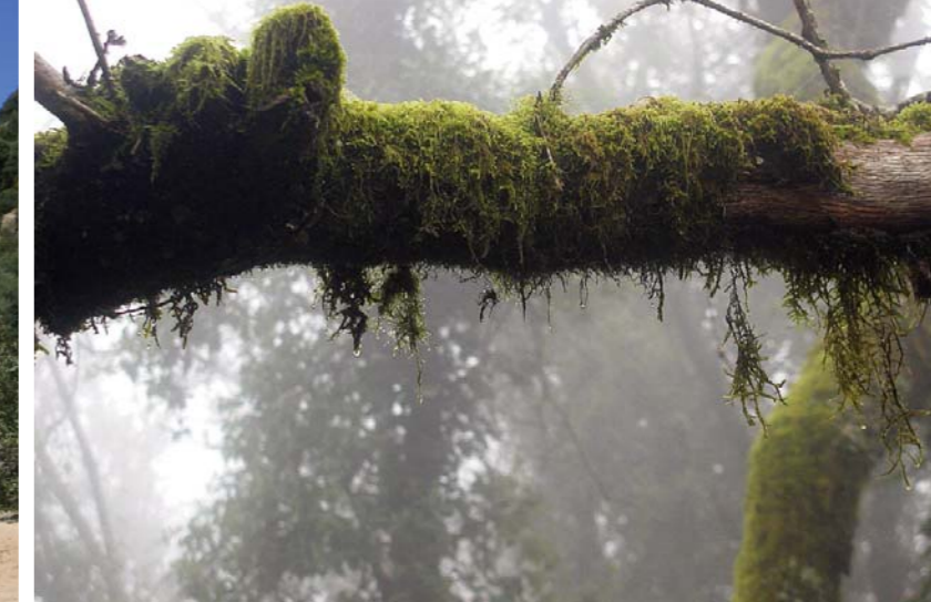
■ Bosque de niebla en los llanos del Juncal

Destacan por lo anteriormente dicho, los itinerarios de "El río de la Miel", en la población de Algeciras y el canuto del "Risco Blanco", en la población de Los Barrios. Son las dos representaciones de senderos por canutos más importantes de la comarca y de los principales del Parque. La del río de la Miel, situada en la barriada de El Cobre, es una ruta fácil, de 4.500 m ida y vuelta que puede realizarse con la familia, encontrándose bien señalizada y trascurriendo durante 1800 m por carril, para pasar luego por un puente de estilo medieval, el cual nos dejará en un bonito sendero, rodeado de helechos, enredaderas, alisos y alcornocales. Podremos ver también antiguos molinos harineros como el de "Escalona" aún en servicio o el del "Águila", ya en ruinas, aunque conservando sus muros y el "Cao" en su parte alta, por donde transcurría el agua. Al final del sendero podremos disfrutar de un bello salto de agua de 6 m de altura.