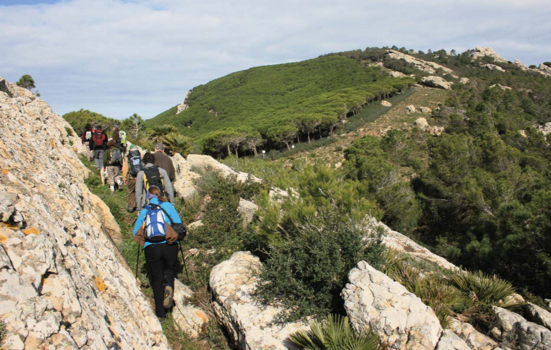
■ Circular a San Bartolomé

La ruta se encuentra en la antigua carretera de Los Barrios a Facinas, hoy día convertida en carril forestal. Para llegar a la misma hay que tomar la salida 77 de la autovía Los Barrios-Jerez de la Frontera. Después de 9 km de pista, encontraremos el cartel señalizador. El itinerario tiene también los atractivos de ver antiguos hornos de carbón así como, con suerte, algún venado. La ruta se encuentra perfectamente señalizada y en sus 4,7 km disfrutaremos como duendes, nunca mejor dicho, caminando entre centenarios quejigos en la parte baja, así como alcornoques y pino de repoblación en la parte alta. Dentro del canuto , la oscuridad es patente debido a la frondosidad de los alisos y quejigos. Aquí, en verano, existe un microclima y la diferencia de temperatura es bastante importante en comparación con el exterior. Si queremos realizar este bello itinerario, hay que solicitar permiso a la dirección del Parque Natural.