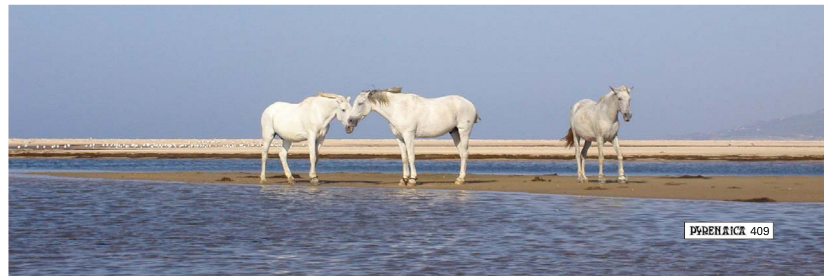
■ Caballos en el GR-7 (Playa de los Lances)

en inviernos lluviosos), podremos cruzar por un paso habilitado con bloques de hormigón.