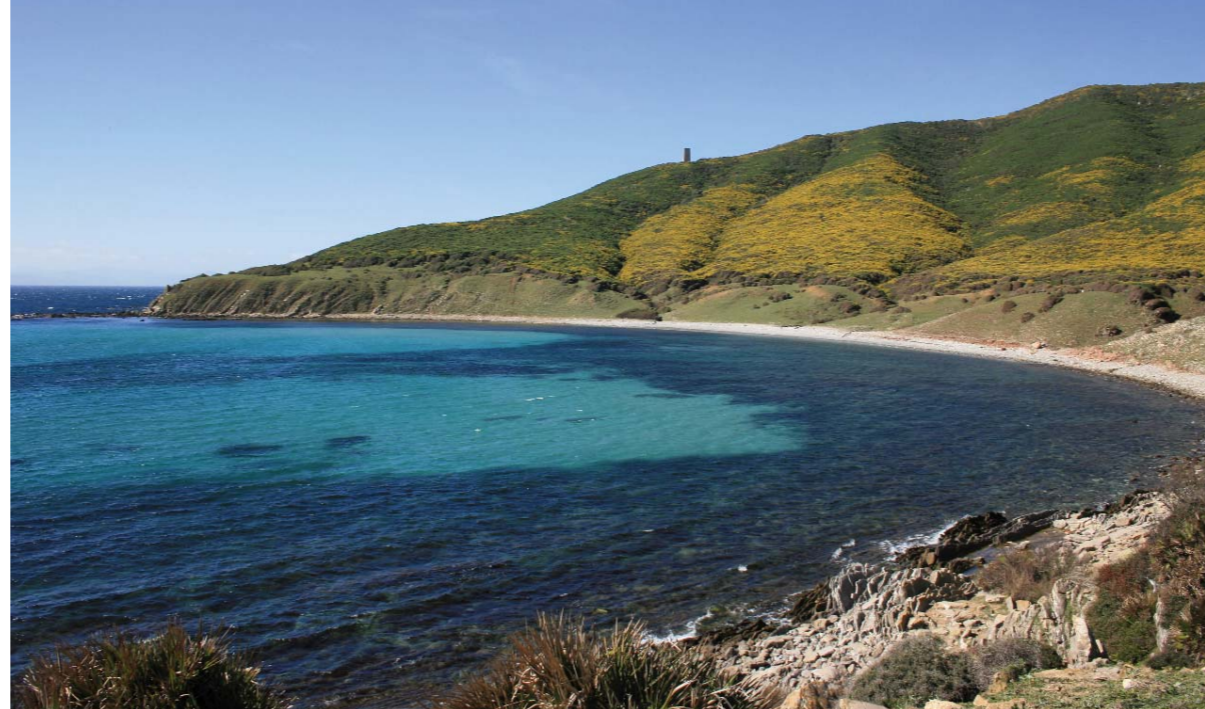
■ Cala Arenas (Colada de la Costa)

Seguiremos molino arriba, un sendero estrecho y bien marcado, hasta llegar al segundo molino, llamado "De en medio", comido ya por la maleza y enredaderas, debido al paso de los años y al abandono de las autoridades que bien podrían mantener dicho sendero y entorno en condiciones, para disfrute de los que amamos el monte. Después de este molino y justo unos metros detrás de él, se encuentra la