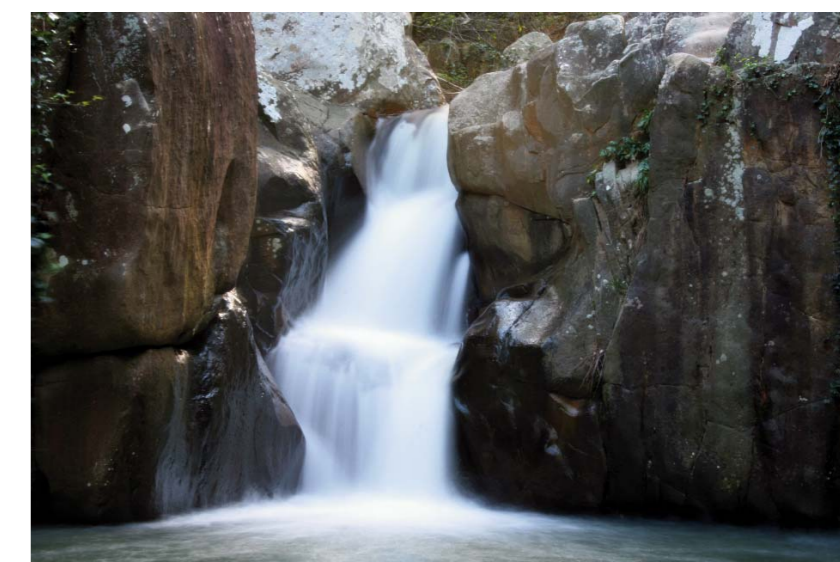
■ Cascada del río de la Miel

Si se quiere proseguir la ruta más arriba, llegando al salto de agua conocido como "Cola de caballo", se tiene que pedir permiso a la dirección del Parque, ya que esta zona alta está catalogada como de máxima protección dentro del espacio natural.