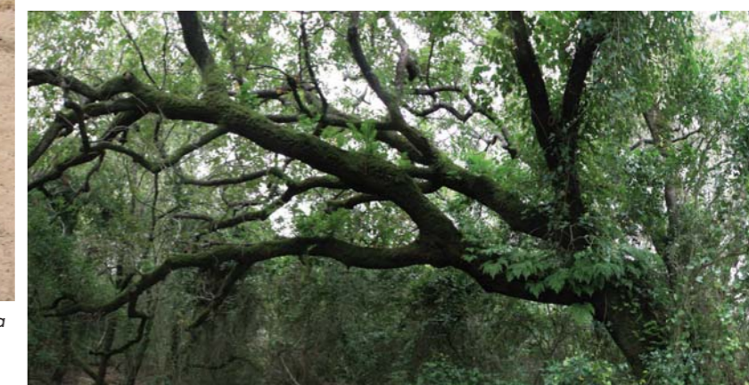
■ Risco Blanco